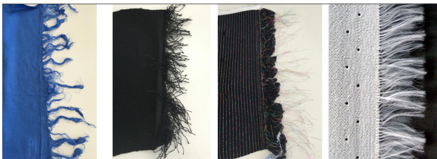
Fili di trama sporgenti (esempi)

Il sensore di warp stop motion SI 2001 comprende una telecamera a matrice con obiettivo, una scheda WLAN, un'unità di valutazione e un emettitore di luce ad anello, necessario per il metodo a luce incidente. Inoltre, l'SI 2001 funziona con un trasmettitore di luce esterno non regolato nel metodo a luce trasmessa. Il filo di ordito più esterno viene riconosciuto e la posizione della cimosa viene trasferita a un controller.