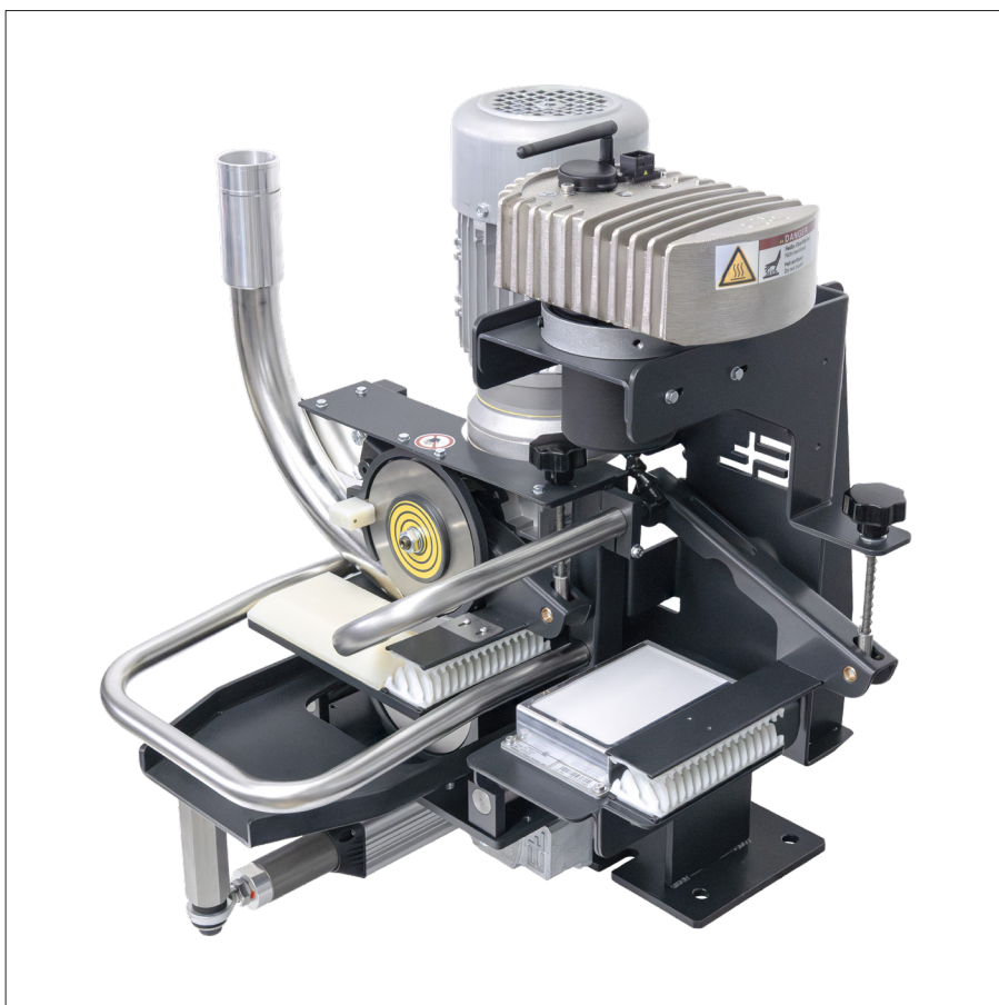
Esempio di applicazione: inseguimento dei coltelli di taglio con dispositivo di taglio BT 8xxx

Il sensore per fili di ordito SI 2001 può essere utilizzato per realizzare il tracciamento dei coltelli di taglio (BT 8xxx) per il taglio dei fili di trama sporgenti all'uscita della rameuse. È inoltre possibile guidare il nastro in base al filo di ordito più esterno.